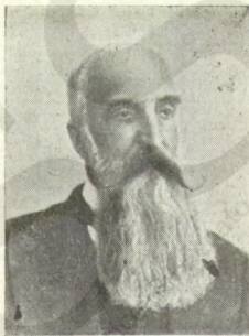
Gian [Giacomo Trivulzio]